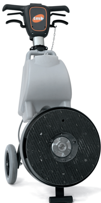
Disco trascinatore Pad driver