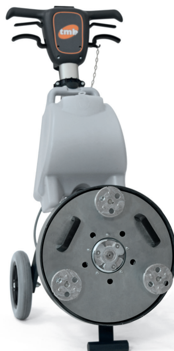
Planetario a 3 dischetti Ø mm 100 Planetary drive plate with 3 discs in Ø 100mm