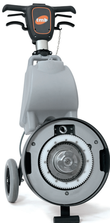
Corona dentata per planetario Crown wheel for planetary drive plate